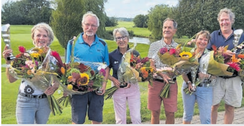
Finalisten clubkampioenschappen Strokeplay par-3 Golfclub Veldzijde. Foto is aangeleverd.