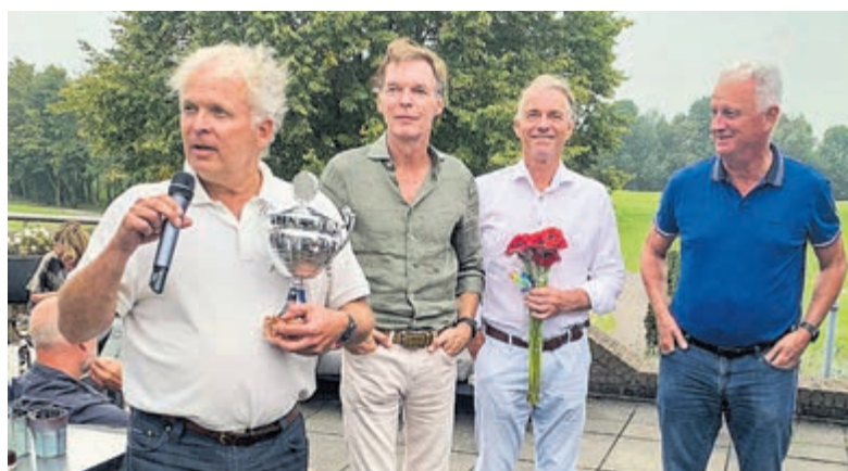
Winnaars van de 25e golfdag: Team Wilgenhaege.