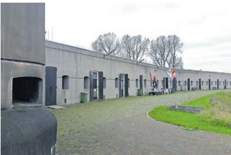
Het Fort bij Aalsmeer in Aalsmeerderbrug. Foto is aangeleverd.

Adres: Aalsmeerderdijk 460 in Aalsmeerderbrug. Kijk voor meer informatie over het museum en het werk van het Crash Luchtoorlog en Verzetsmuseum '40-'45 op de website: www.crash40-45.nl of raadpleeg Instagram of de Facebookpagina.