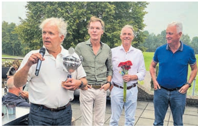
Winnaars van de 25e golfdag: Team Wilgenhaege. Foto is aangeleverd.