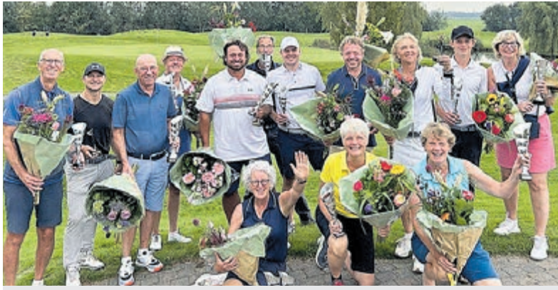
Finalisten clubkampioenschappen Strokeplay 18-holes baan 2024 Golfclub Veldzijde. Foto is aangeleverd.