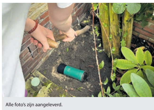
Alle foto's zijn aangeleverd.