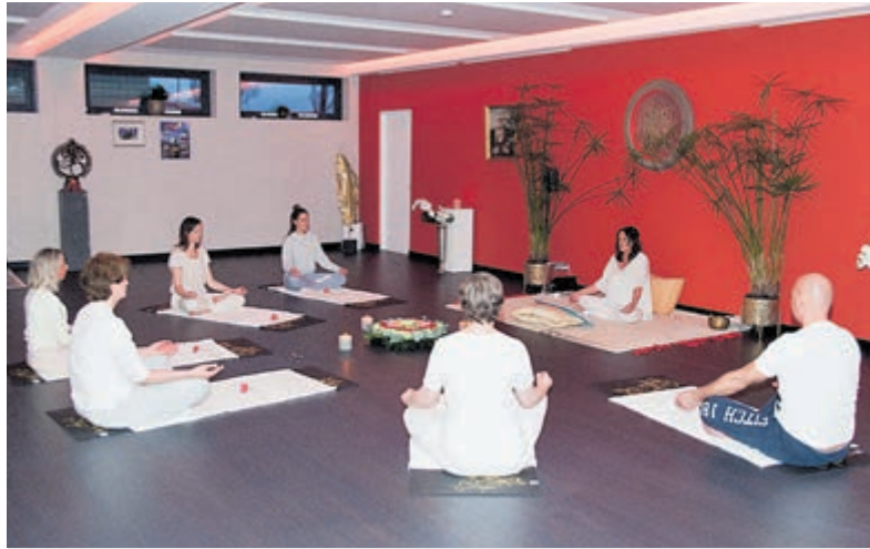
Yoga cursus door Inge Saraswati.