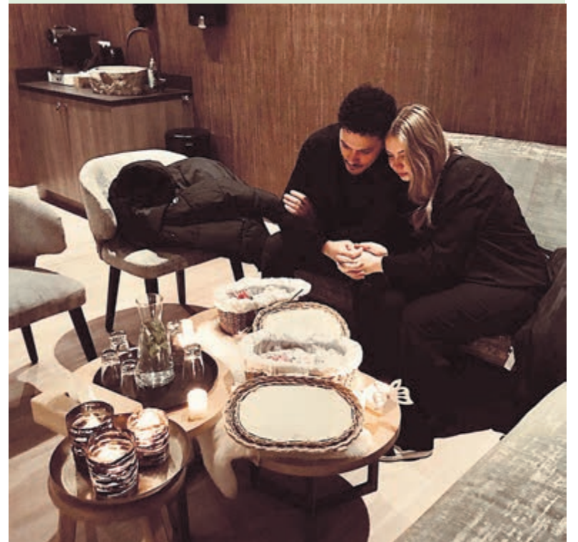
Tekst en foto's zijn geplaatst met volledige instemming van de betrokkenen.

Elk traptrede die ik daarna neem richting de ovenruimte voelt loodzwaar.