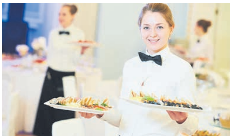
Ook de horeca kampt met tekorten aan vakmensen.

(Diverse bronnen: CBS, Nationale Vacaturebank, AFAS Foundation, SRH Haarlem University of Applied Sciences.)