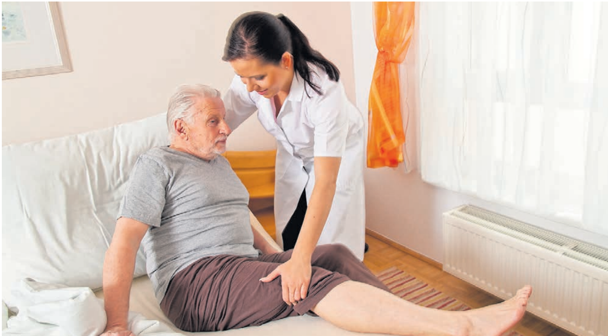
Handen aan het bed in de zorgsector.