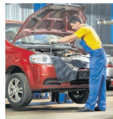
Automonteurs zijn moeilijk te vinden om vacatures op te vullen.