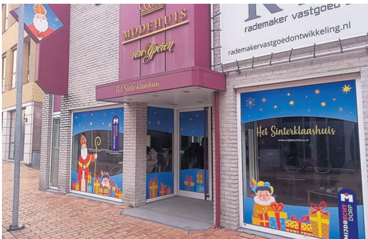
Alle foto's zijn aangeleverd.

Ik wens Sint Nicolaas nog een goede nachtrust toe en dat hij een fijne tijd in Nederland zal hebben. Hij bedankt mij voor het interview en laat nog weten dat de kinderen hem op woensdagmiddag 20 november van 15.00 tot 17.00 uur en op zaterdag 23 oktober van 14.00 tot 16.00 uur nog in het Sinterklaashuis in Mijdrecht kunnen opzoeken. Op deze dagen zijn de deuren van het Sinterklaashuis in het oude pand van Yperen mode (Dorpsstraat 9-11) geopend en maakt hij met zijn Piet graag even tijd voor alle lieve kinderen. Dit is natuurlijk een perfect moment om je verlanglijstje te overhandigen, de kleurplaat in te leveren, een praatje te maken met Sinterklaas en natuurlijk kan je op de foto met deze vredelievende man. Pak die kans!