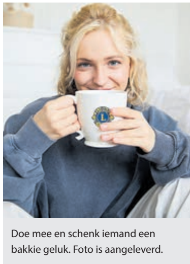
Doe mee en schenk iemand een bakkie geluk. Foto is aangeleverd.

Misschien heb jij nog Douwe Egberts waardepunten in een la liggen. Geef ze dit jaar een mooie bestemming en help mee om koffie toegankelijk te maken voor iedereen. Je kunt jouw waardepunten inleveren op één van de inzamelpunten in de regio.