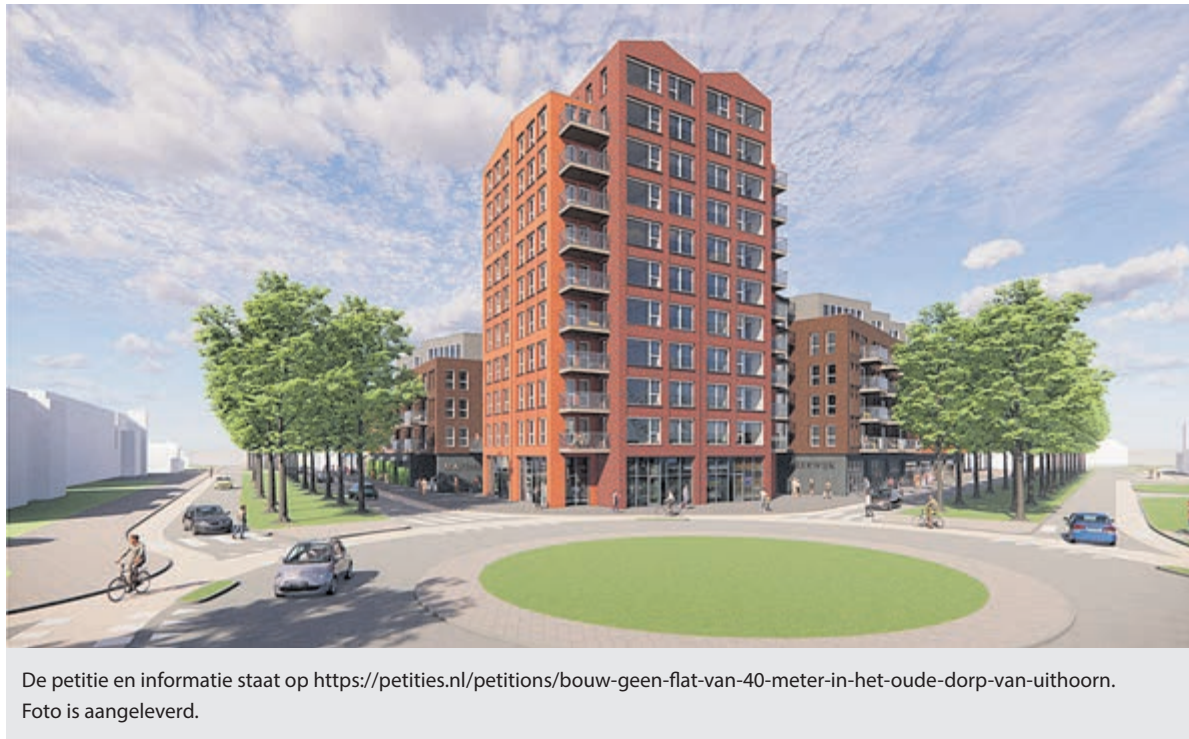
De petitie en informatie staat op https://petities.nl/petitions/bouw-geen-flat-van-40-meter-in-het-oude-dorp-van-uithoorn . Foto is aangeleverd.

UITHOORN IN OPSTAND TEGEN WOONTOREN VAN 40 METER