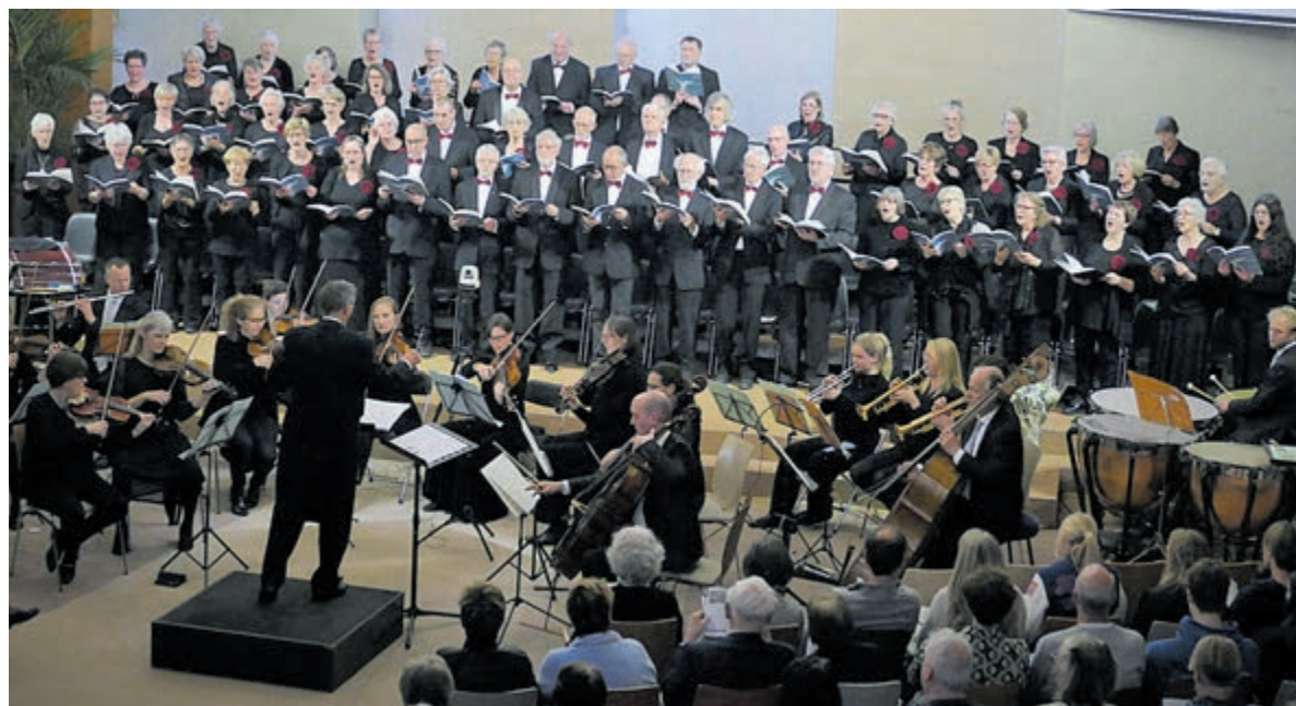
Het koor Amicitia. Foto is aangeleverd.

Toegangskarten inclusief consumptie à € 27,50, voor de jeugd t/m 17 jaar € 15,- zijn te bestellen via de leden of via www.amicitia-uthoorn.nl .