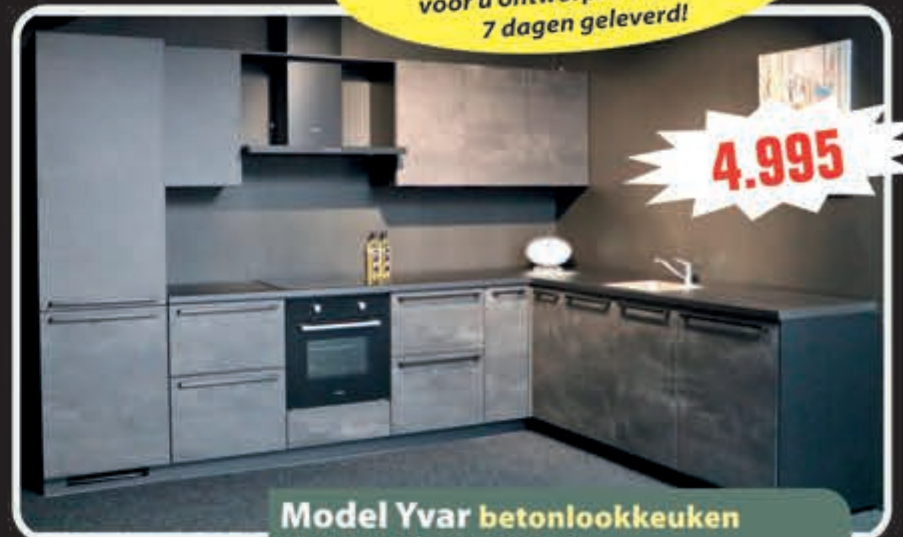
Model Yvar betonlookkeuken uit voorraad, 330 x 243 cm.

Supercompleet met oven, kookplaat, vaatwasser, brede blokschouw, koelkast/vriezer, aanrechtblad, spoelbak en kraan, met 5 jaar garantie. Aanpassingen mogelijk!