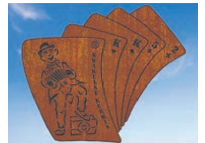
De schetsontwerpen voor het kunstwerk De Kwakelse Kermis. Links ontwerp A: 'Kermisboek'. Rechts ontwerp B: 'Speelkaarten'.