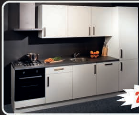
Model Jack softmat witte keuken uit voorraad, 270 cm.

Gezien op TV! 1000 Duitse Keukens in alle afmetingen voor u ontworpen én binnen 7 dagen geleverd!