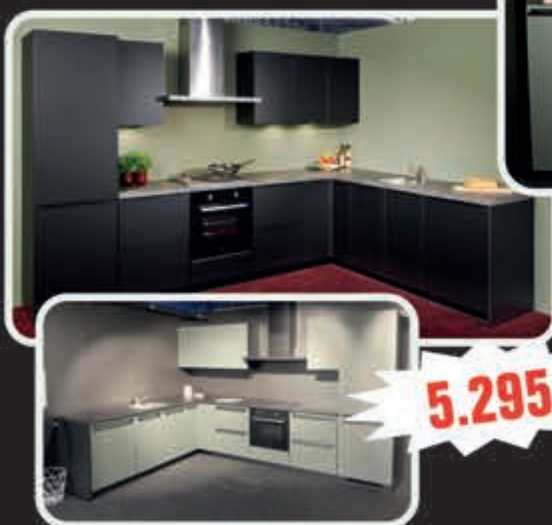
Model Fred mat zwart of mat groen uit voorraad, hoekkeuken 330x242 cm of Model Frits mat zwart of mat groen uit voorraad, recht 300 cm.

Ook nog 100 uitverkoopkeukens in onze uitverkoophal!