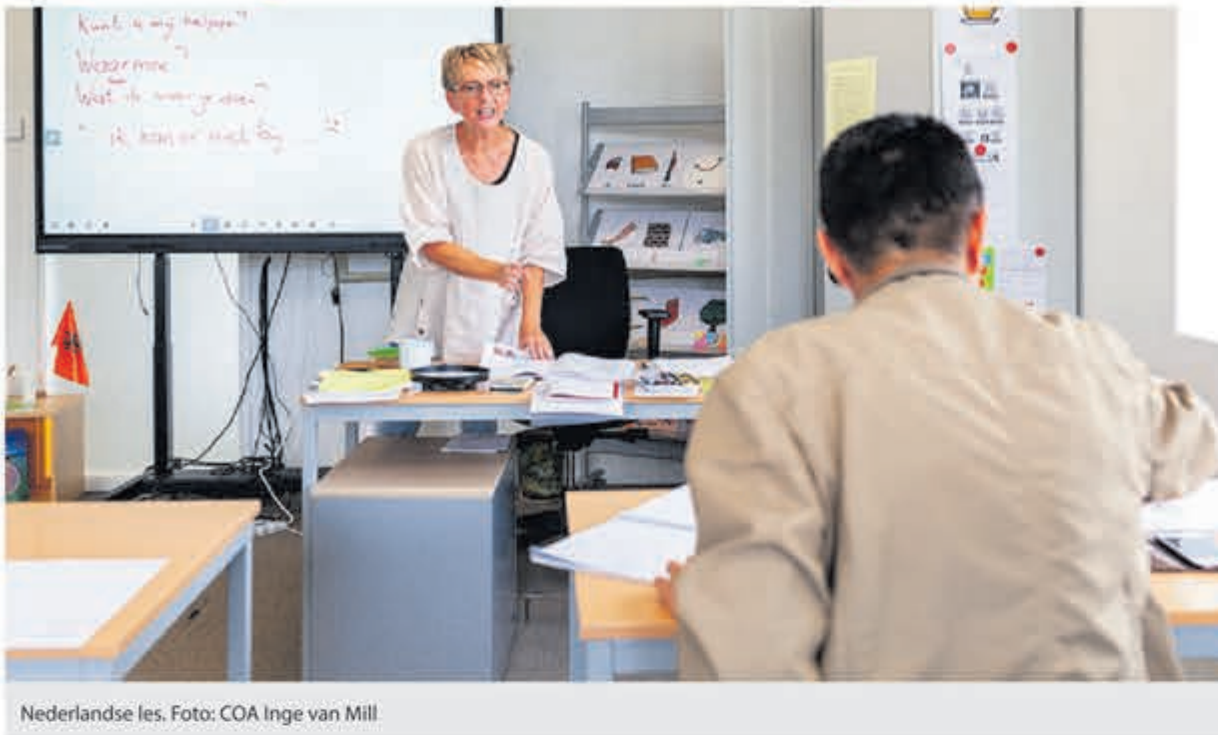
Nederlandse les.