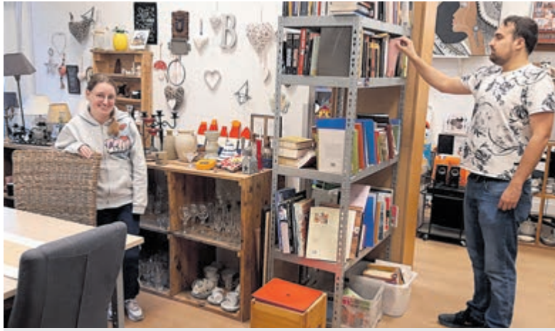
Ruilhuis Morgenster al twee jaar een succes. Foto is aangeleverd.

Onderdeel van Regio Media Groep B.V. www.regiomediagroep.nl