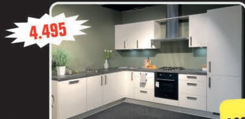
Model Leo softmat wit uit voorraad, 243 x 330 cm.

Supercompleet met oven, kookplaat, vaatwasser, brede blokschouw, koelkast/vriezer, aanrechtblad, spoelbak en kraan, met 5 jaar garantie. Aanpassingen mogelijk!