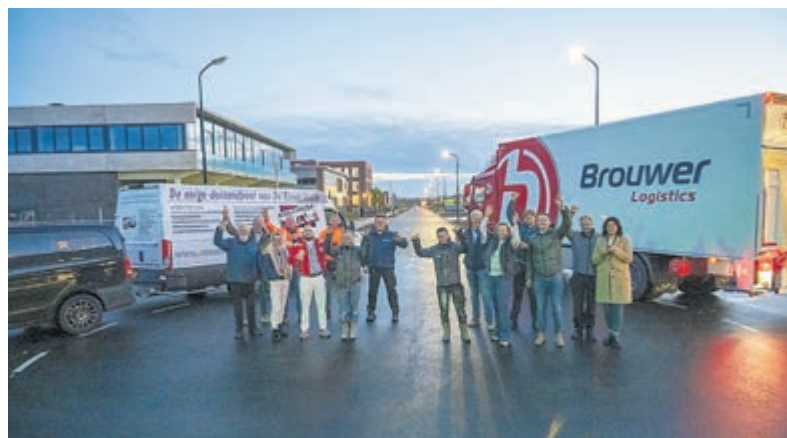
Ondernemers bij opening Vermogensweg.