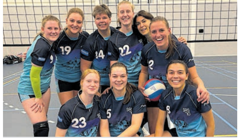
SAS Dames 1.