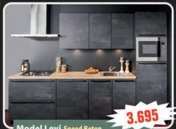
Model Levi Speed Beton uit voorraad, 300 cm.

Supercompleet met combimagnetron, kookplaat, vaatwasser, brede blokschouw, koelkast, aanrechtblad, spoelbak en kraan, met 5 jaar garantie. Aanpassingen mogelijk!