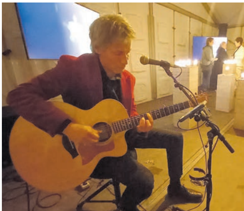
Alle foto's zijn aangeleverd.

een onderdeel van het leven is en dat de dood het leven ook zoveel rijker maakt. Veel mensen zien de dood als een eindpunt. Ik denk dat je het eerder kan beschouwen als een orgelpunt. De melodie is nog niet klaar, je klinkt als mens nog lang na."