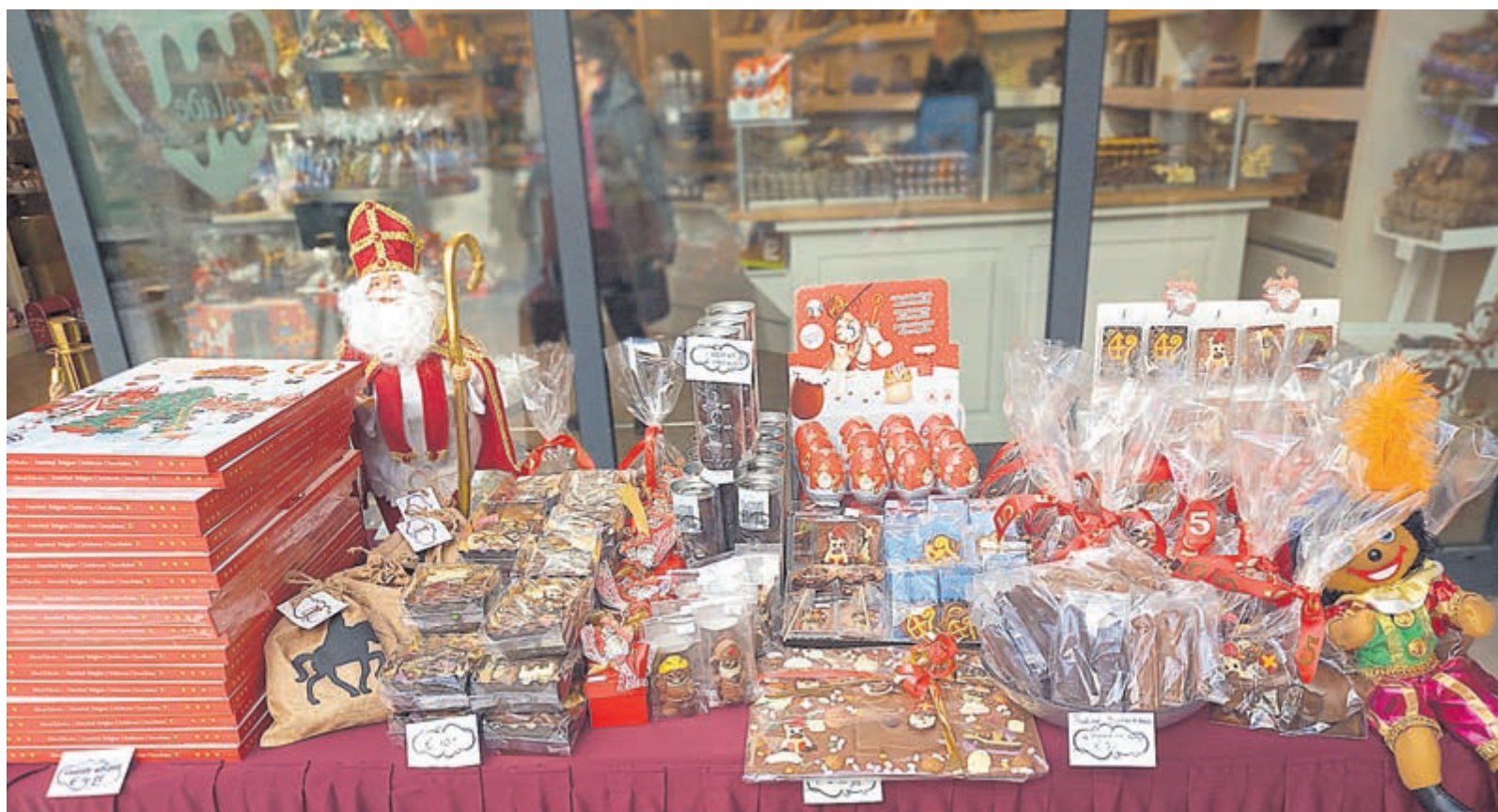
Heel veel cadeautjes