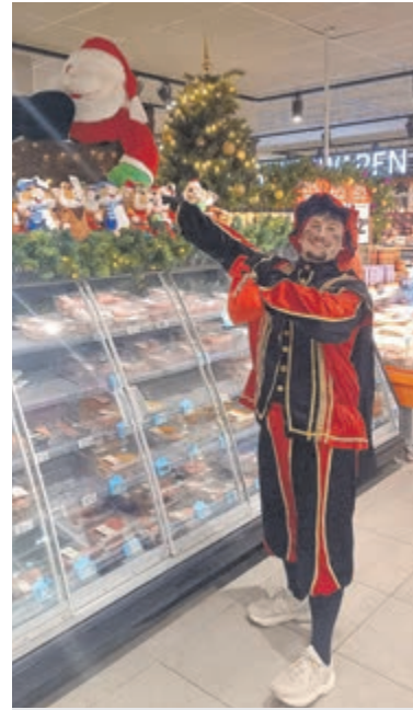
Kerstman in Albert Heijn.