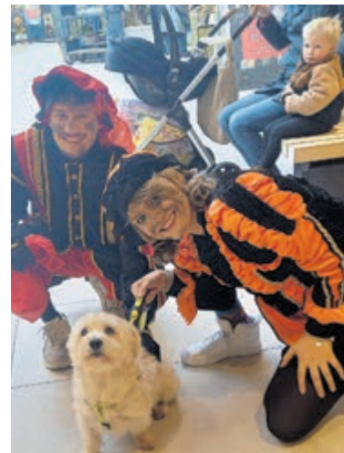
Ook kleine hondjes mochten op de foto.