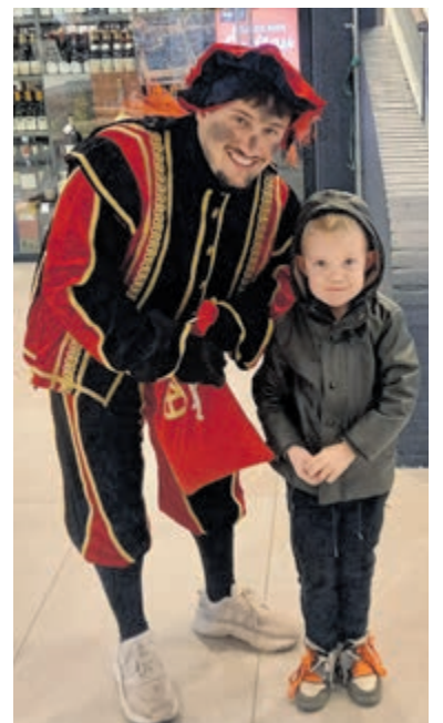
Op de foto met pretpiet.