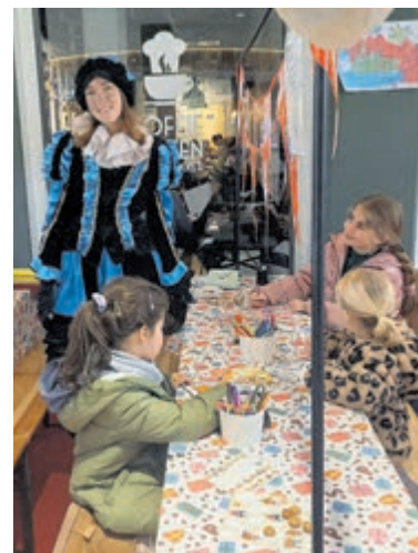
De creabea knutselpiet.