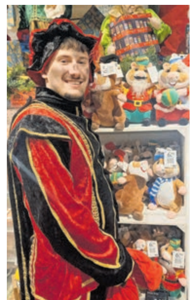
Cadeaupiet aan het hamsteren.