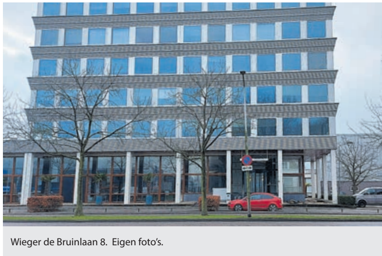
Wieger de Bruinlaan 8.