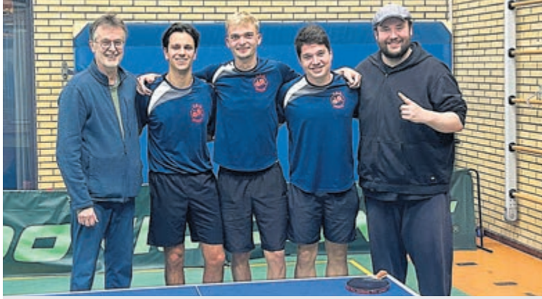
VDO Team 1. Foto is aangeleverd.