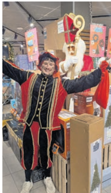
Was Sinterklaas even komen kijken?

Toen wij nog even door de winkels wandelde zagen wij daar de Cadeaupiet al heel veel spulletjes inkopen voor al die lieve kinderen in Uithoorn. En we dachten zelfs Sinterklaas even te spotten, maar die stelde zich wel een beetje verdedt op achter allerlei pakjes die Cadeaupiet had verzameld. Kortom het was weer een gezellige middag op het Amstelplein.