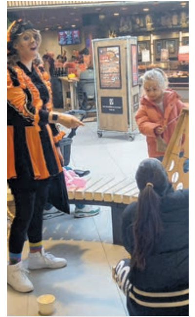
Spelletjes spelen met spelletjespiet.