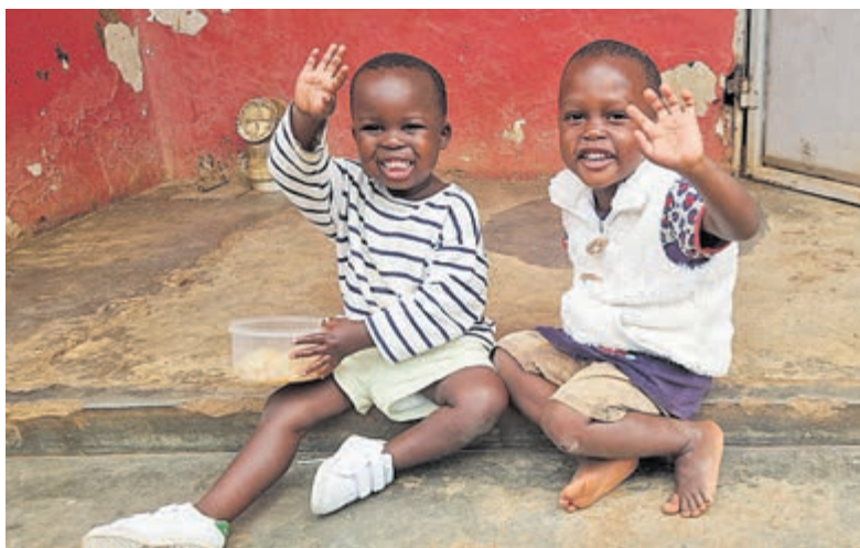
Zingen voor kindertehuis Foodstep in Uganda. Foto is aangeleverd.