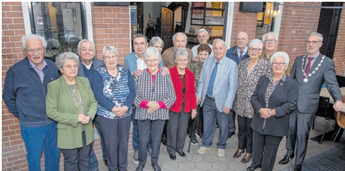
Diamanten echtparen op de foto met de burgemeester.