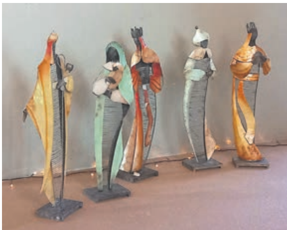
Alle foto's zijn aangeleverd.