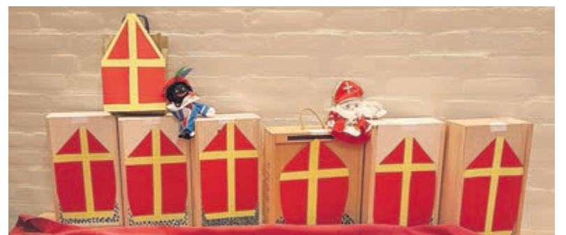
Een Sinterklaasverrassing voor de bridgers.