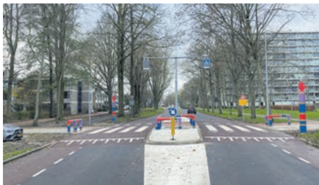
Foto: De "nieuwe" Arthur van Schendellaan. Foto genomen nabij de oversteek Spaaklaan.

Ondanks de gefaseerde uitvoering en inzet van een brede communicatie kunnen we begrijpen dat de wegafsluiting op sommige momenten als vervelend en onhandig is ervaren. Namens het projectteam (aannemer en gemeente) willen we benadrukken dat we mede dankzij uw medewerking en daarmee getoonde betrokkenheid op een prettige manier onze werkzaamheden konden uitvoeren. Dank daarvoor en tevens voor uw getoonde begrip. Op naar weer een nieuwe klus!