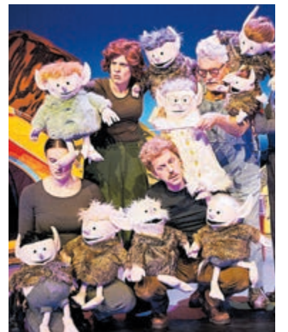
De Gorgels. Foto is aangeleverd.

Kruimeltje en de strijd om de goudmijn (6+) Tijdens de kerstvakantie duikt Nederlands favoriete straatschoffie op voor een gloednieuw avontuur. Ditmaal in het wilde westen. Kruimeltje en de strijd om de Goudmijn is een spannende familiemusical, waarin Kruimeltje in het verleden van zijn vader duikt in Amerika. Te zien op zaterdag 4 januari. Meer informatie: www.schouwburgamstelveen.nl .