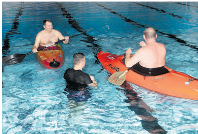
Kajakken in het zwembad.