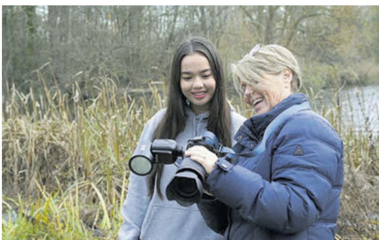
Workshop fotografie voor nieuwe leden Fotokring Uithoorn. Foto is aangeleverd.

shop. Deze workshop is ook aangeboden aan andere nieuwe leden. De workshop had als titel: 'Portret op locatie, omgaan met natuurlijk licht' en vond plaats onder leiding van