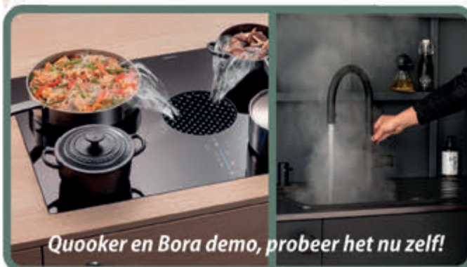
Quooker en Bora demo, probeer het nu zelf!