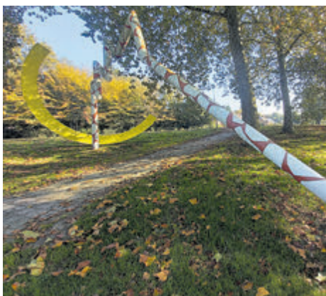
Dit beeld staat niet in Uithoorn.

Bij de opgave in de maand november was foto 3 van het kunstwerk wat hieronder staat afgebeeld niet te vinden in Uithoorn. Dit staat dit in Mijdrecht en is aldaar bekend onder de naam 'de maan'. De andere drie prachtige beelden die getoond werden staan wel in onze gemeente. Het waren wat abstractere kunstwerken.