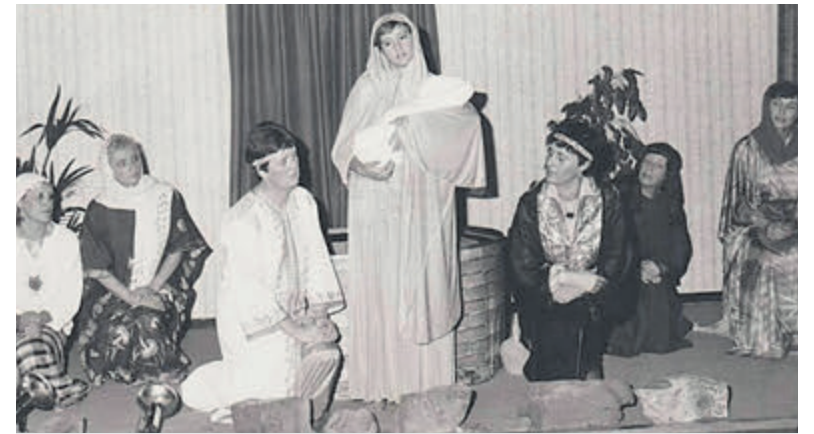
'Wij vrouwen van Bethlehem'. Foto is aangeleverd.

Arie Noteboom gedigitaliseerd en geschikt gemaakt voor vertoning. Als er een jaar is om te overdenken dan is het wel dit jaar. Wat is er wereldwijd veel gebeurd, maar voor velen ook dichtbij en persoonlijk. Het doet goed om even de tijd te nemen om hierbij stil te staan. Op maandag 30 december is Open Huis De Rank hiervoor tussen 16.30 en 19.30 uur geopend. De ruimte is sfeervol verlicht en er klinkt zachte muziek. Bezoekers kunnen een kaars aansteken, luisteren naar de muziek en hun gedachten laten gaan.