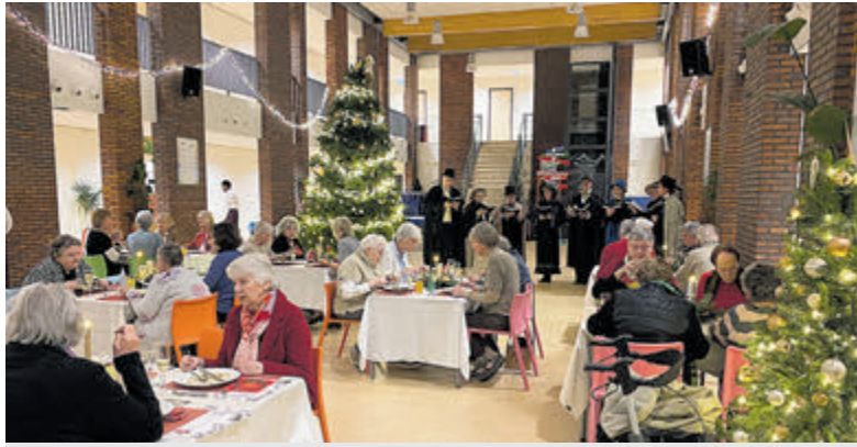
Zo'n 40 buurtbewoners waren aanwezig en genoten van een gezellige maaltijd. Foto is aangeleverd.